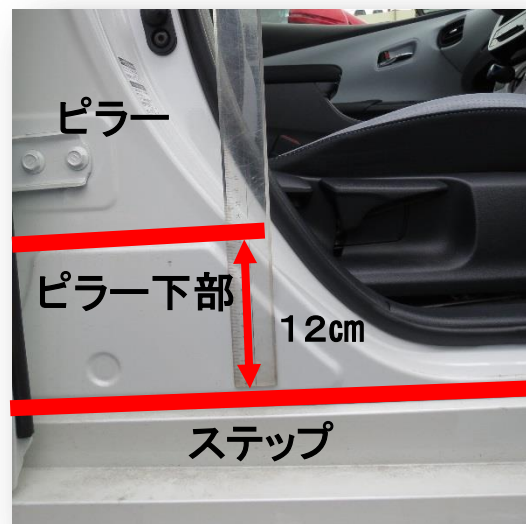
※2 変更後 基準線